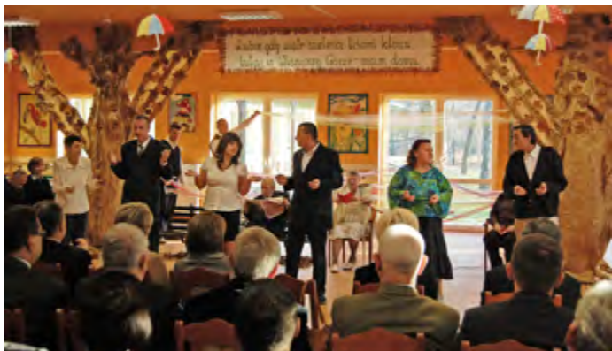
Program artystyczny w wykonaniu mieszkańców podczas uroczystego otwarcia DPS.