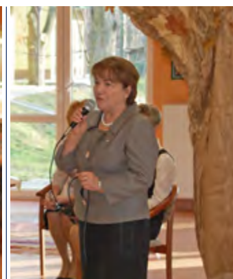
Krystyna Ozga - Poseł na Sejm RP