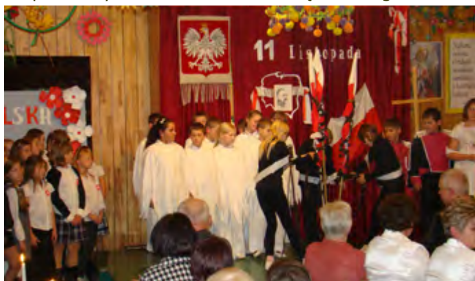
Dzieci ze Szkoły Podstawowej im. Orła Białego w Kurowicach