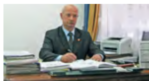
PIOTR BUSIAKIEWICZ STAROSTA ŁÓDZKI WSCHODNI